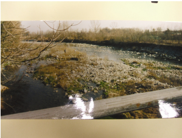
Il torrente Sangone in Bassa Valle

Attraversa i comuni di Trana, Sangano, Bruino, Rivalta, Orbassano e Beinasco: sfocia infine nel Po, vicino a Moncalieri.