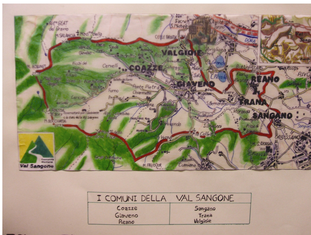
Cartina geografica della Val Sangone realizzata su lucido dagli allievi

Complessivamente il territorio godeva di una situazione di relativa stabilità economica, che garantiva la continuità della cultura locale e impediva lo spopolamento.