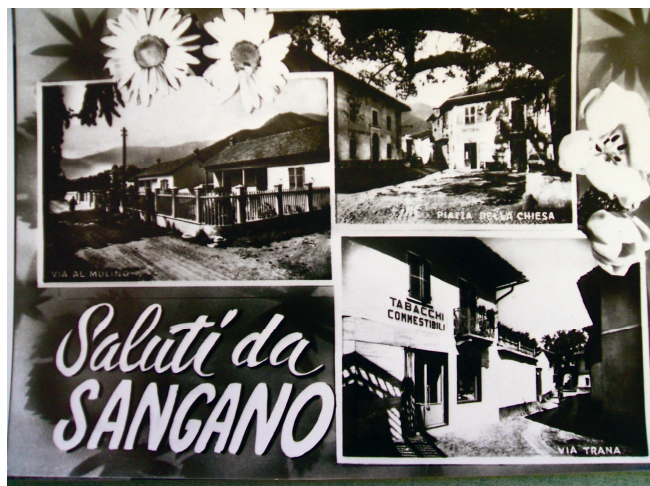
Una cartolina dell'epoca