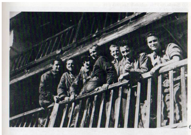
Gruppo partigiano della Val Sangone

In seguito, ciò che favorì il contatto tra queste organizzazioni fu essenzialmente la guerra e in particolare la situazione confusa e disastrosa in cui lo Stato italiano si trovò nell'estate del 1943 con la conseguente "complicità" delle forze angloamericane, che compresero la strategica importanza dell'attività resistenziale per le sorti del conflitto e che quindi provvidero ad armarle e aiutarle anche per gli aspetti logistici.