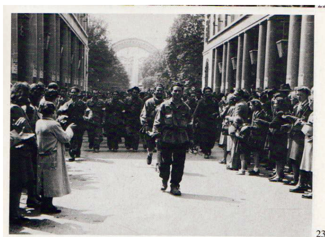
I Partigiani della Val Sangone sfilano a Torino dopo la Liberazione

Nell'Italia del Nord la lotta partigiana ebbe, tanto nelle città quanto nelle campagne, vasto appoggio dalla popolazione civile, che per tale motivo subì atroci rappresaglie. Tra le tante ricordiamo la strage a Marzabotto (BO), dove, tra il 29 settembre e il 1° ottobre 1944 vennero trucidate circa 2.000 persone.