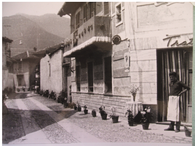
Una delle principali vie del paese all'epoca