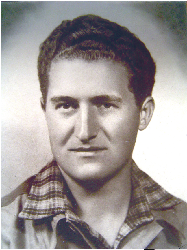
Foto originale del ritratto

senza distinzioni sociali, culturali e razziali, ma accomunata da un unico ideale: quello di una Patria libera e democratica.