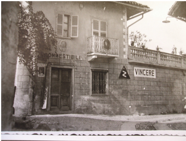
Scritte e simboli fascisti sui muri delle case di Sangano