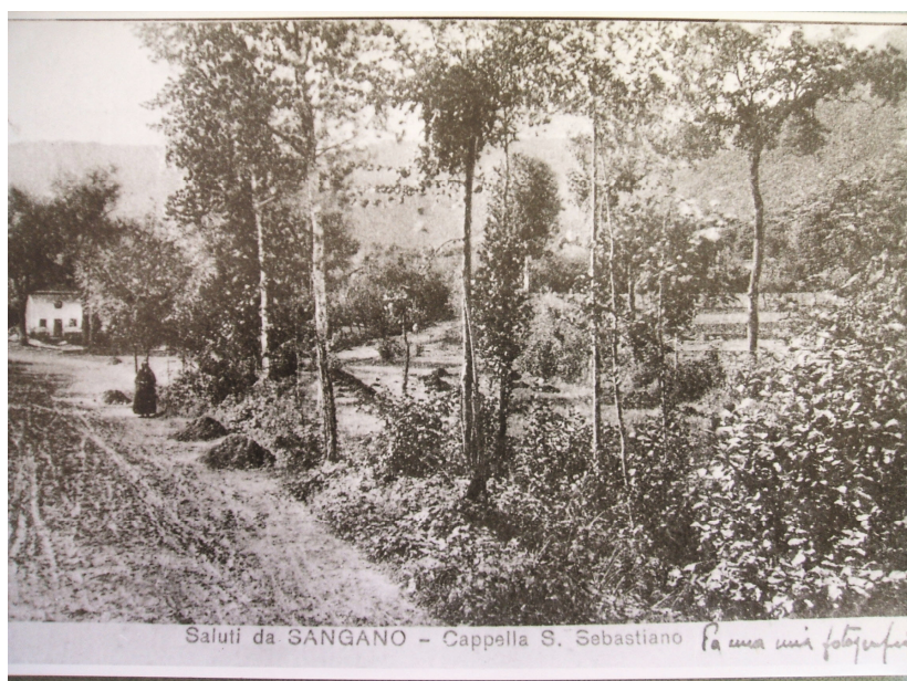
Una veduta della cappella di San Sebastiano

Attraverso le parole di Franz, l' autore ci descrive non soltanto Sangano, paesino di per sé anonimo, ma riferisce anche dell' importanza strategica che il paese rappresentava per il comando tedesco, per la presenza di una polveriera, un avamposto al limite dei boschi, importante tanto strategicamente quanto psicologicamente, specie per le unità di guerriglieri partigiani che in quelle zone operavano.