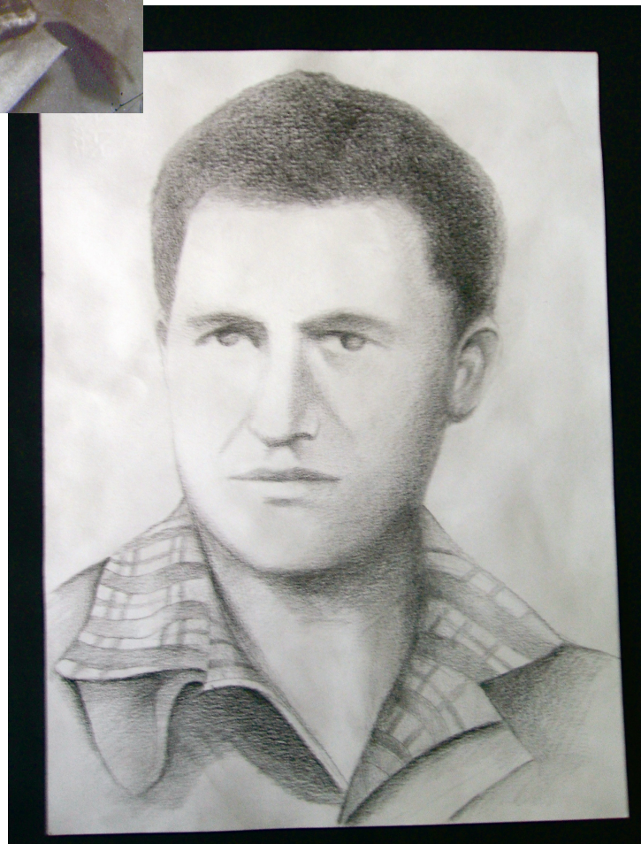
Copia del ritratto realizzato dall' alunna Elena Vacchetta