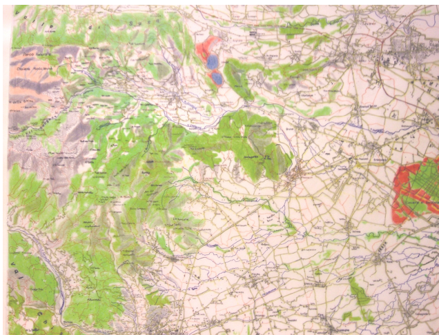
Carta topografica dell' Alta Valle realizzata dagli alunni della scuola

Tra gli anni Trenta e Quaranta la popolazione era dispersa in decine di borgate, piuttosto simili nella struttura edilizia, formate da poche case ravvicinate o attaccate l'una all'altra per non sottrarre all'agricoltura terreno coltivabile.