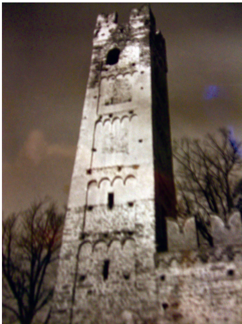
La Torre di Sangano