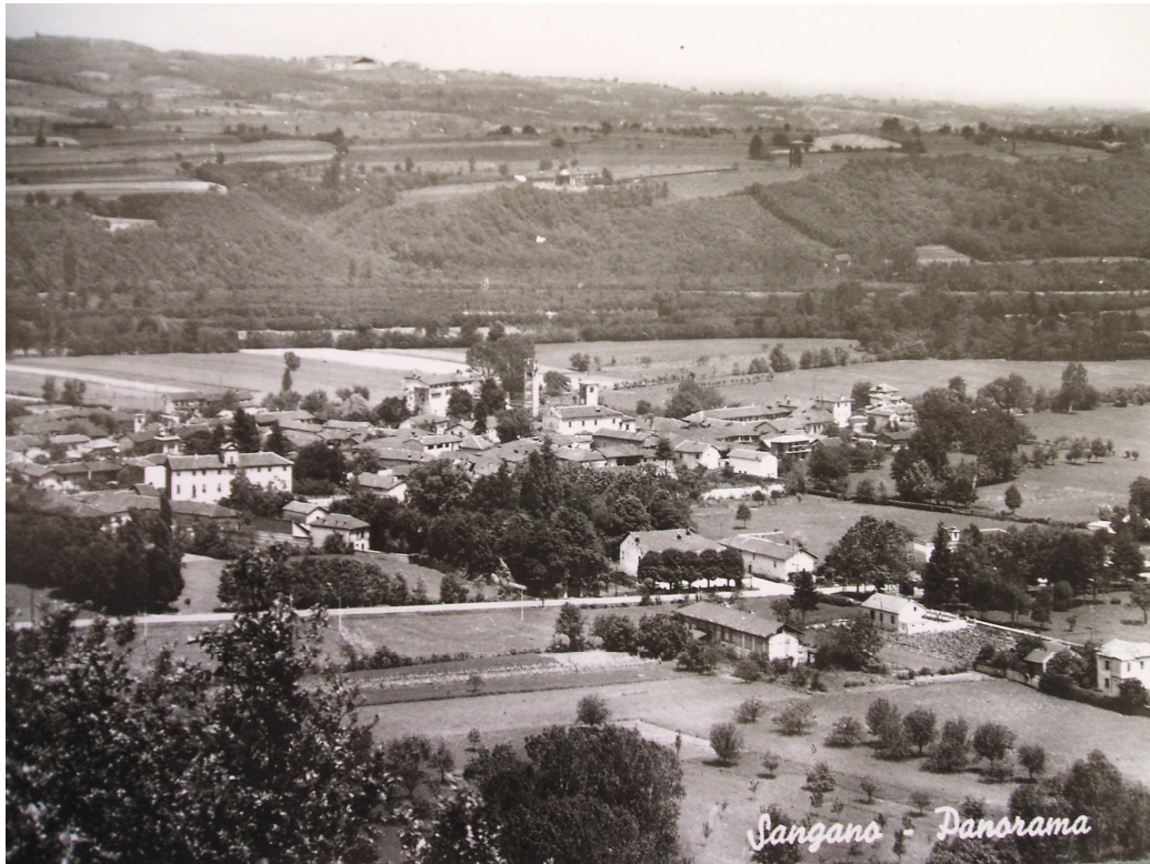
Panorama di Sangano