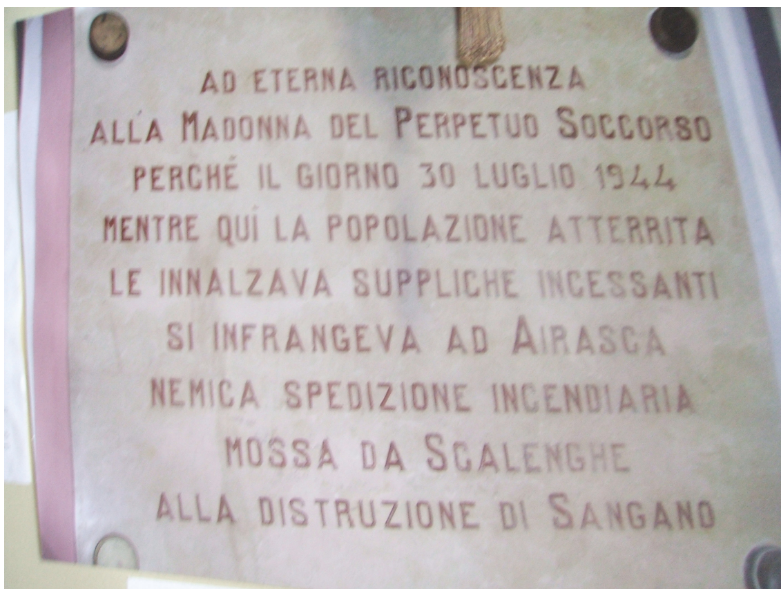
La lapide nel presbiterio della cappella del Soccorso della Chiesa Parrocchiale di Sangano

Una lapide nel presbiterio della Cappella del Soccorso nella Chiesa Parrocchiale di Sangano fu posta a ricordo di questo avvenimento.