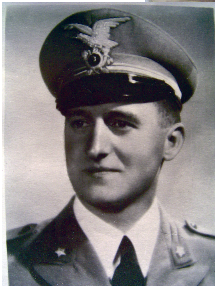
Ufficiale all' Accademia di Modena