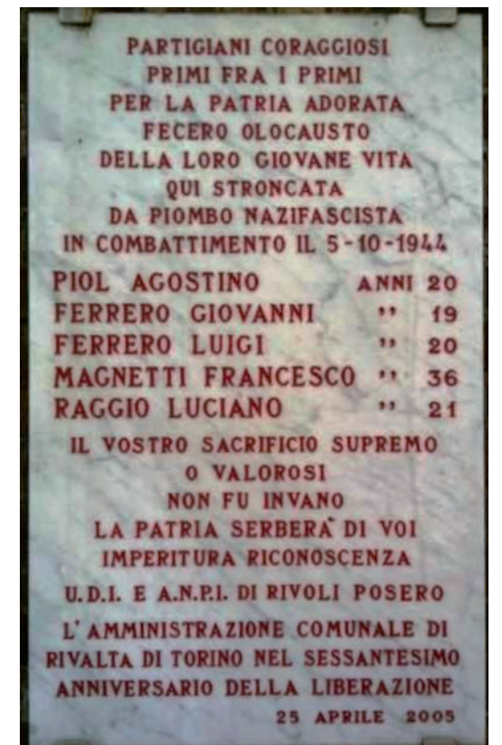
La lapide a RIVALTA